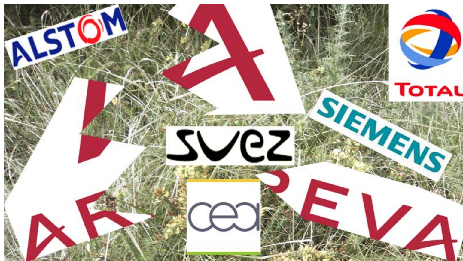
Qui emportera le leader mondial du nucléaire ?