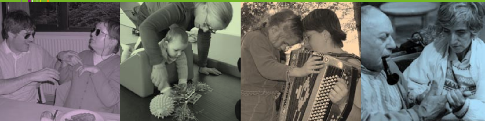
SCHÉMA NATIONAL D'ORGANISATION SOCIALE ET MÉDICO-SOCIALE POUR LES HANDICAPS RARES 2009-2013

A ttendu par les personnes confrontées à des handicaps rares et leur famille, par les professionnels chargés de l'évaluation et de l'accompagnement de ces situations très complexes, le premier schéma national d'organisation sociale et médico-sociale pour les handicaps rares a été adopté par le ministre du Travail, des Relations sociales, de la Famille, de la Solidarité et de la Ville et la secrétaire d'État chargée de la Famille et de la Solidarité.