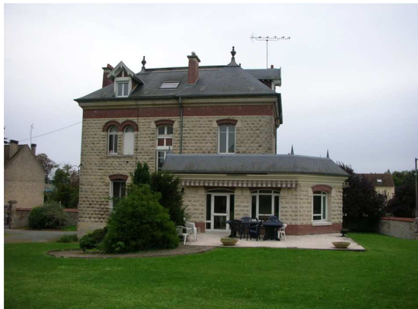
BORAN sur OISE Propriété actuelle et projet d'EHPAD de 24 lits